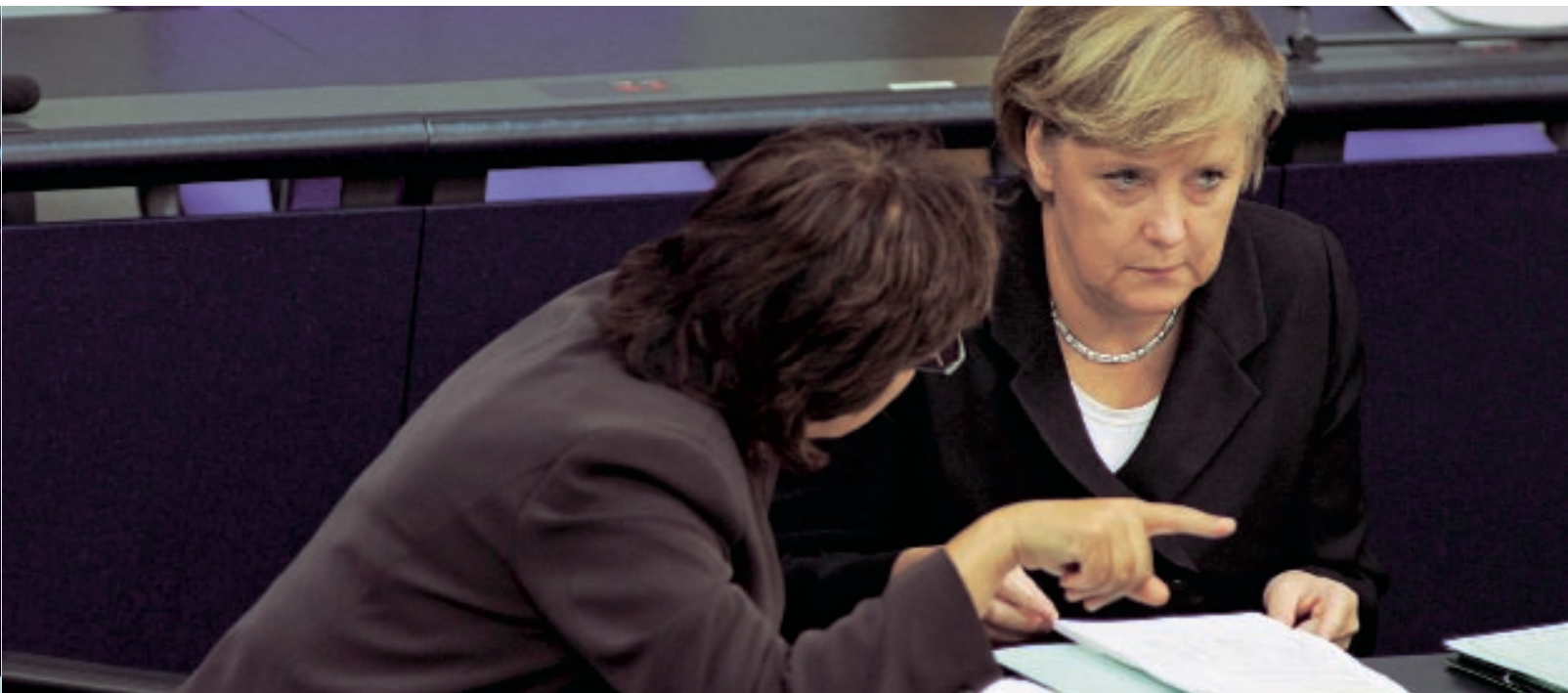
Ministerin Ulla Schmidt und Kanzlerin Angela Merkel haben eine Gesundheitsreform ausgeheckt, die sehr teuer und wenig visionär ist.